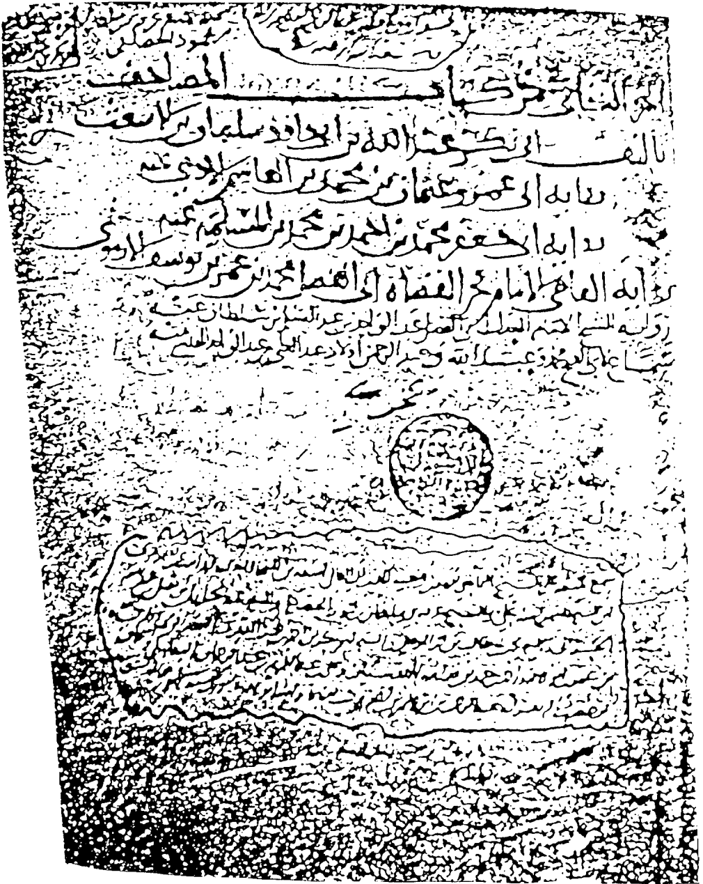
لوحة عنوان الجزء الثاني من «ظ»